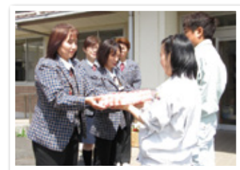
ヤクルトレディの皆様