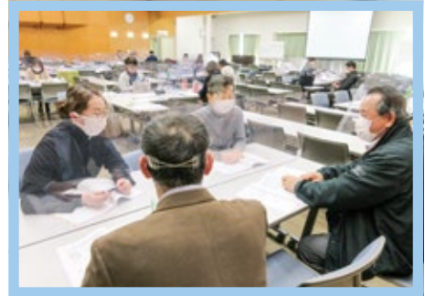
講師による 演習のシミュレーション

受講者の皆様や講師の皆様にご協力いただき、無事集合研修を終えることができました。