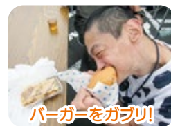
バーガーをガブリ!

コロナ禍で外出の機会が減ってしまったため、気分転換をはかろうと2台のキッチンカーに来て頂きました。『カーネギー55』の佐世保バーガー、『87キッチン』のオムライスのどちらかを選んで食べました。大きなハンバーガーやとろとろのオムライスに感動！サイドメニューのからあげ、フライドポテト、タピオカドリンクなど、とてもおいしかったです♪