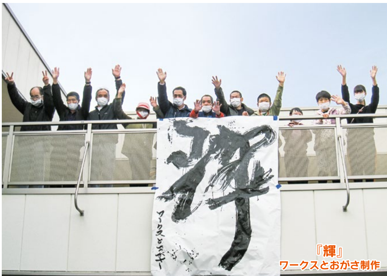
『輝』 ワークスとおがさ制作

障害者支援施設/あまぎ学園・ワークスうしぶせ・かめぎ学園・ワークスとおがさ・静岡県立富士見学園 障害福祉サービス事業所/クリエート太陽 共同生活援助事業/コミュニティ浮島、フレンズ井上・岡宮・下香貫・宮本、ファミーコ西性路・ふたせがわ 原・まつなが・さくら・なおや・宮本・原団地・片浜・原町、サンライズ宮本・西性路・まつなが 障害者就業・生活支援センター事業/障害者就業・生活支援センターひまわり 地域生活定着促進事業/静岡県地域生活定着支援センターひまわり 沼津市障害者相談支援事業・指定特定相談支援事業/生活支援センターあしたか 公益事業/研修センター