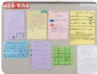
各委員会掲示物 カラフルに 仕上がっています。

あまぎ学園自治会は、生活充実・環境美化・体育・保健・放送広報の5つの委員会から構成されています。各委員長を中心に内容を考え、活動しています。利用者が日頃から活動の意識を持つ為に、各委員会で掲示物を自分たちで作成しています。