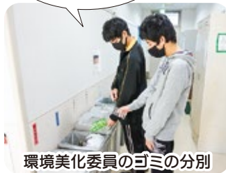
環境美化委員のゴミの分別