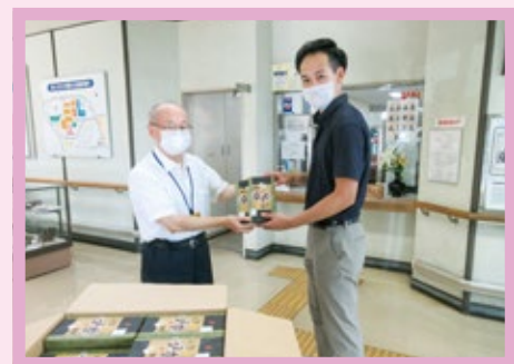
【土井製菓 様】 美味しくいただきました。