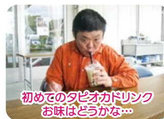
初めてのタピオカドリンク お味はどうか...

コロナ禍で外出の機会が減ってしまったため、気分転換をはかろうと2台のキッチンカーに来て頂きました。『カーネギー55』の佐世保バーガー、『87キッチン』のオムライスのどちらかを選んで食べました。大きなハンバーガーやとろとろのオムライスに感動！サイドメニューのからあげ、フライドポテト、タピオカドリンクなど、とてもおいしかったです♪